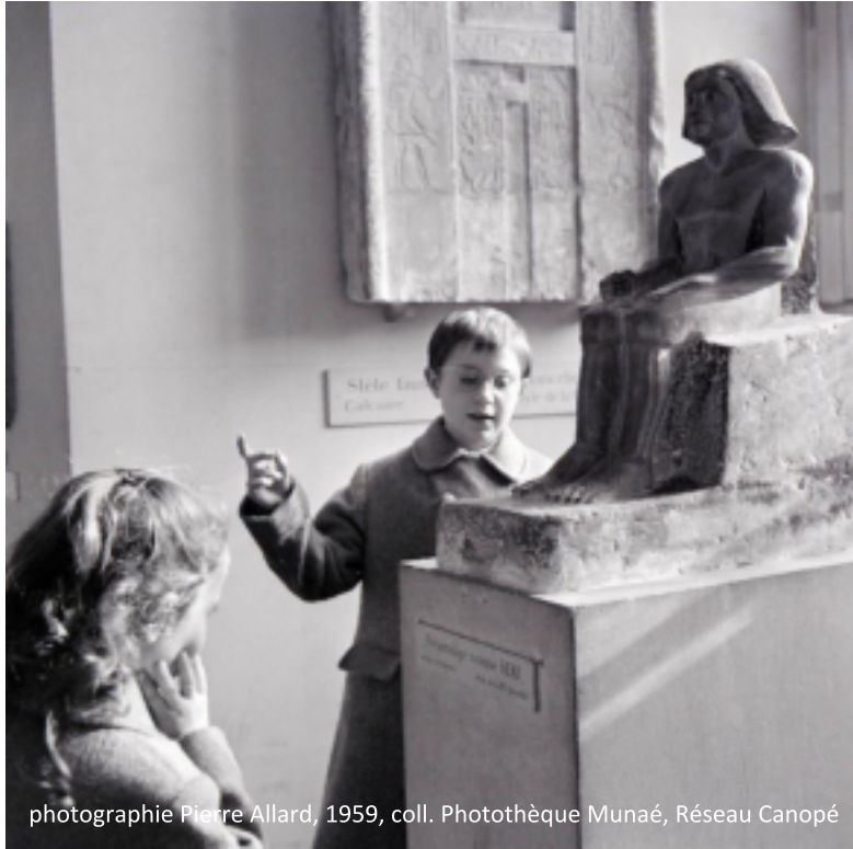
photographie Pierre Allard, 1959, coll. Photothèque Munaé, Réseau Canopé

sous la direction de Sylvie Sagnes et Thierry Wendling